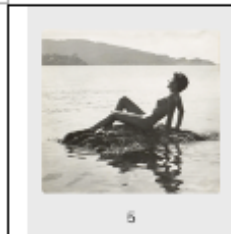
Production still zu WIR FAHREN ZUM NATURISTEN-PARADIES, in: Privates Fotoalbum Werner Kunz [I/II], in: Privataarchiv Nachlass Werner Kunz, sowie production still Nr. 46 zu WIR FAHREN ZUM NATURISTEN-PARADIES, in: Ordner «ÎLE DU LEVANT» (hier ab dem Negativ), in: Archiv Imperial Film