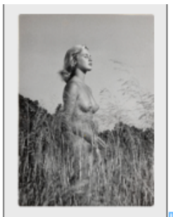
Production still zu WIR FAHREN ZUM NATURISTEN-PARADIES (1957), sowie production still Nr. 78 zu WIR FAHREN ZUM NATURISTEN-PARADIES

Production still Nr. 1 zu WIR FAHREN ZUM NATURISTEN-PARADIES